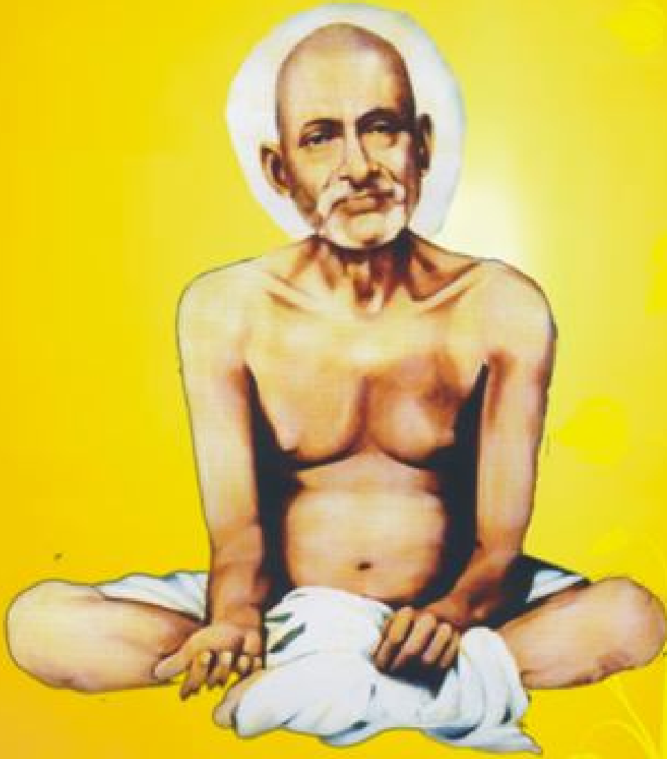
श्री संत सद्गुरु गजानन महाराज, शेगांव